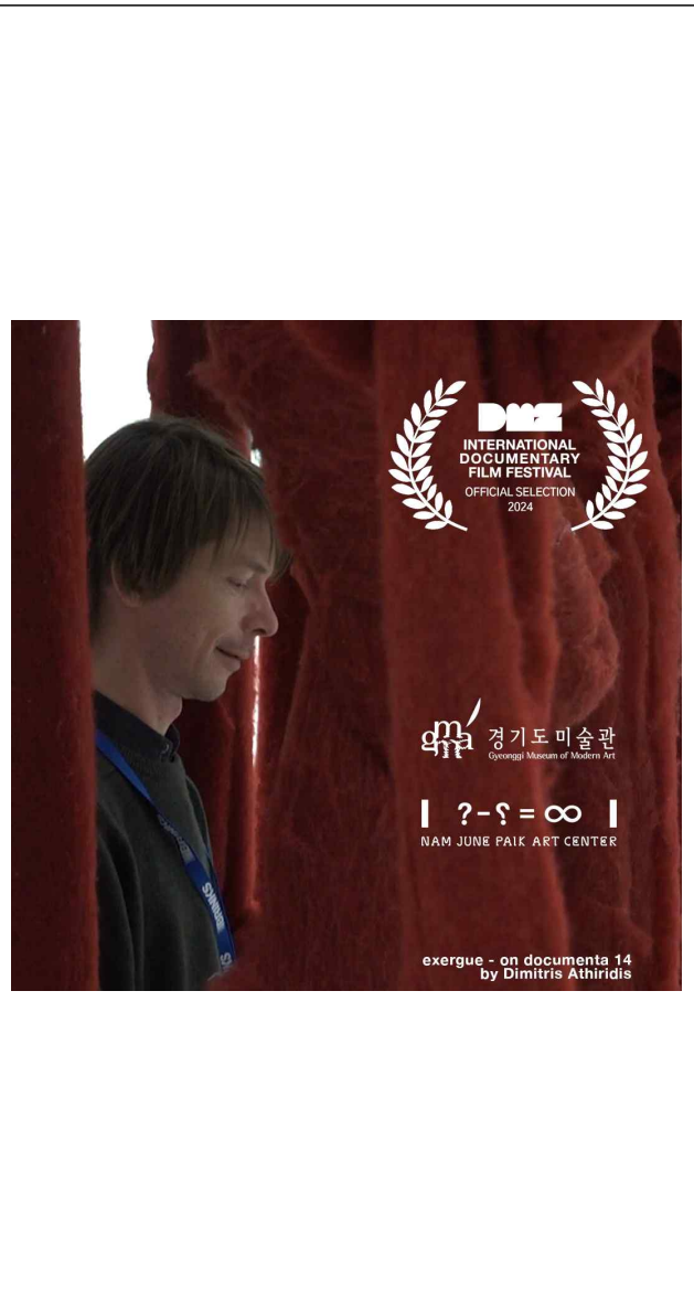
(공식 포스터 이미지제공: DMZ국제다큐멘터리영화제 조직위원회 프로그램팀)