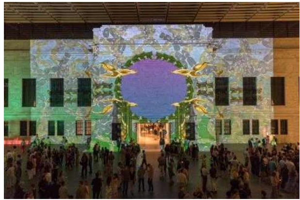
알루_Museum Media Facade