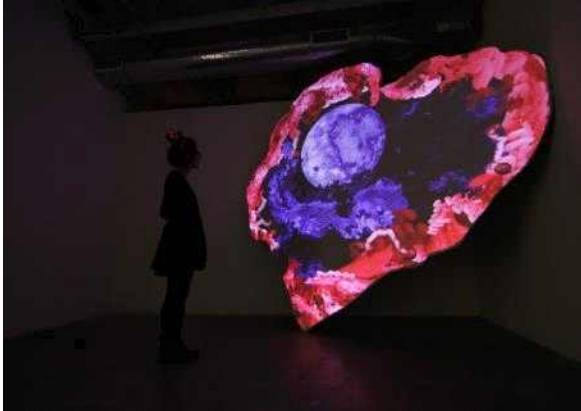
알루_Charm for Heart I, Romactic Cinema_2018