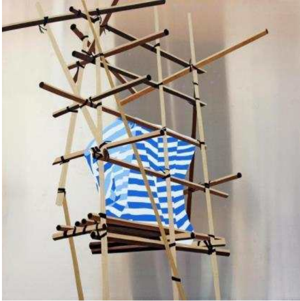
김지은: <줄무늬 프로젝트 #1>, 2015, 알루미늄 판에 시트지, 91.5x91.5cm