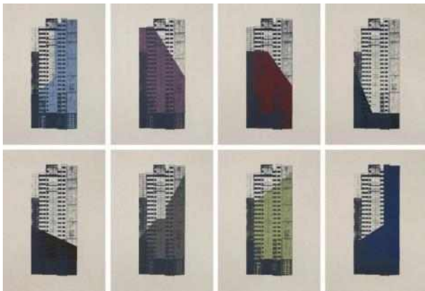
김희진: <판교 휴먼시아 1-8>, 2020, 장지에 실크스크린, 각 33.4x24.2cm