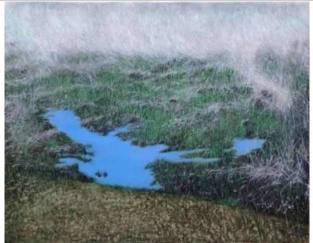
박지수: <Spring(샘)>, 2023, oil on paper, 72.7x 90.9cm