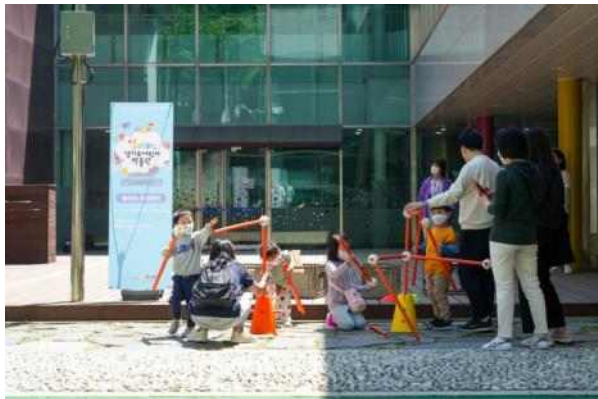
2022년 어린이날 행사 사진2 (곰자락 놀이터)