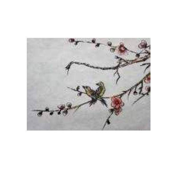
※ 실학박물관 홍보 이미지 6부