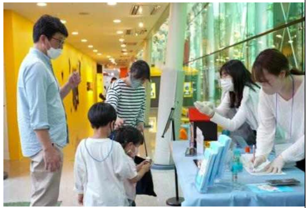
2022년 어린이날 행사 사진