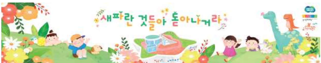
▶ 어린이날 행사 홍보물 디자인