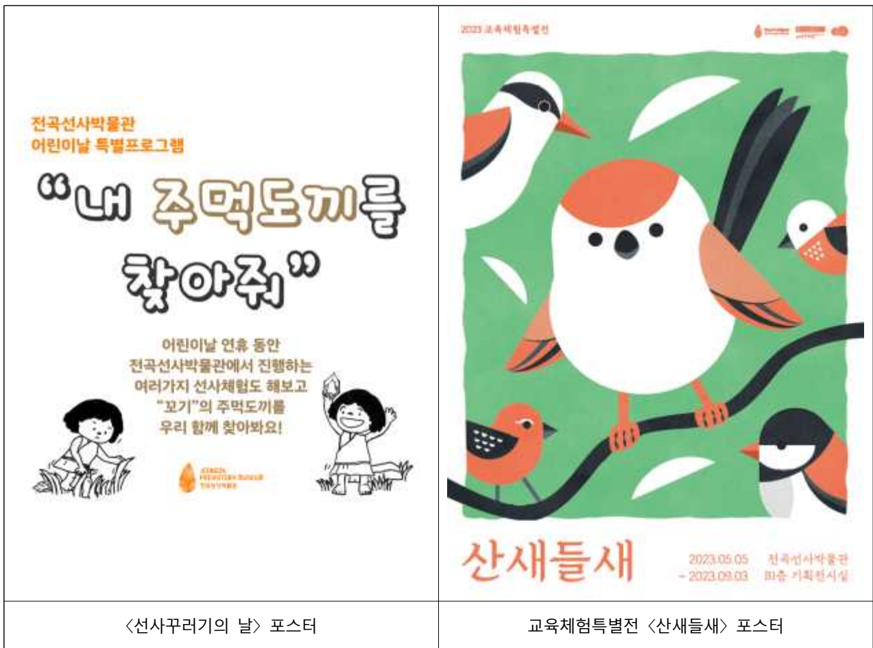
<선사꾸러기의 날> 포스터