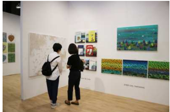
사진 4. 2022 아트경기 아트페어 부스전 <KIAF PLUS 부스전> (SETEC)