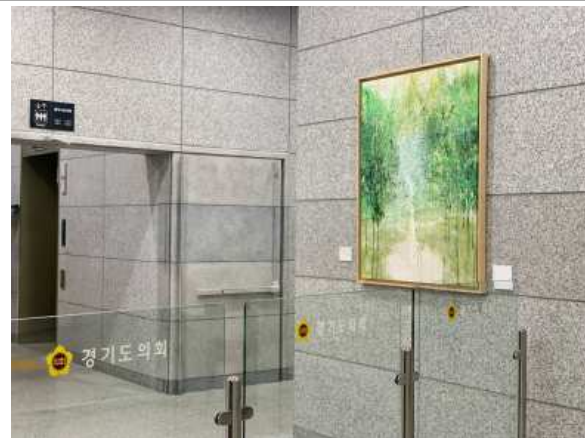
사진 5. 2022 아트경기 미술품 임대·전시 (경기도의회)