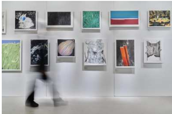
사진 3. 2022 아트경기 팝업갤러리 <TP: Printed Edition> (LCDC 서울 DDMYY)