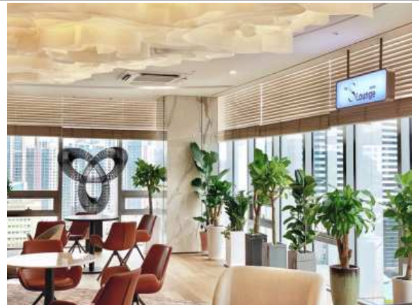
사진 6. 2022 아트경기 미술품 임대·전시 (신한은행 PWM 패밀리오피스 반포센터)