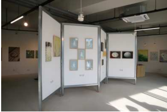
사진 1. 2022 아트경기 미술장터 - 경기장터 (파주 아트팩토리)