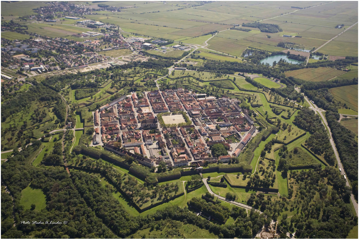
사진 2. 세계유산 '보방의 요새들' 중 신도시 '네프-브리작(Neuf-Brisach)'