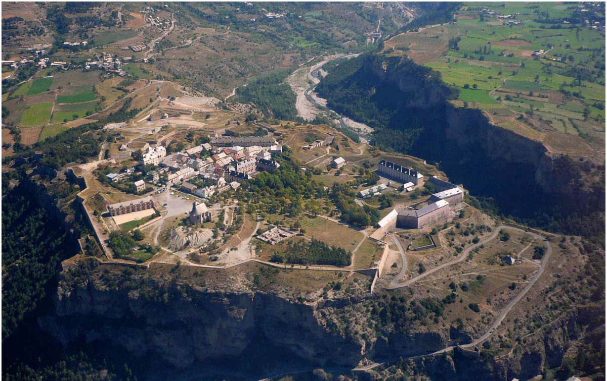
사진 3. 세계유산 '보방의 요새들' 중 산악요새 '몽-도팽(Mont-dauphin)'