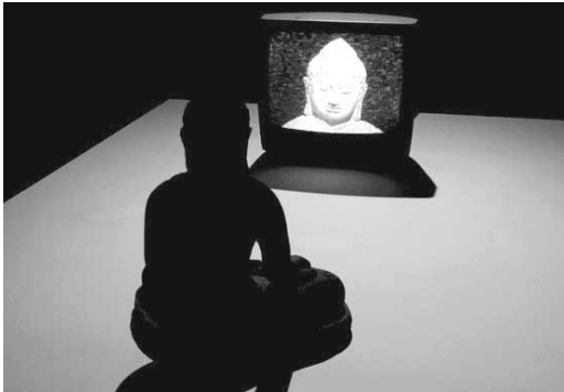
백남준 作 "TV Buddha"

재단은 자체 목적사업 외에도 경기도와 시·군이 문화예술진흥을 위해 위탁한 사업을 자체 심의위원회를 통하여 수탁하여 추진하고 있다. 1999년 「효사상고취프로젝트」 사업을 시작으로 2004년 말까지 수탁 된 사업은 총 89개 사업에 1,001억 6,721만원의 사업비가 교부되었다. 2004년에 수탁 된 사업은 「2004 경기실학현양사업」등 총 7개 사업으로 위탁사업비는 총 30억 3,395만 원이 교부되었다.