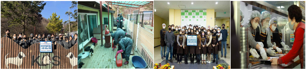
사회공헌활동(현장 봉사): 유기견보호소 청보 봉사(22.11.19) / 노인복지관 배식 봉사(22.11.30)