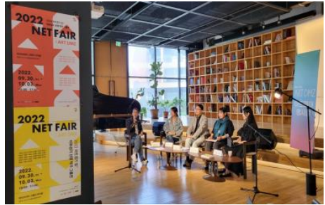
▲ <2022 NET FAIR-ART DMZ : 아트경기 업 ↑ > (라이브러리스테이 지하향)