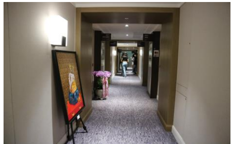
▲ 2022 아트페어 참가 <PLAS x JW 메리어트 부스전> (서울 JW 메리어트 호텔)