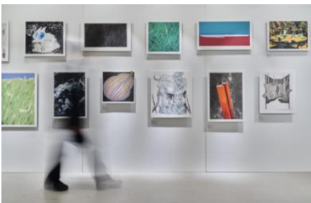
▲ <TP: Printed Edition>(LCDC 서울)