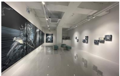
▲ <2022 아트경기 미술장터>(서울 올댓큐레이팅) ▲ <2022 아트경기 미술장터>(서울 올댓큐레이팅)