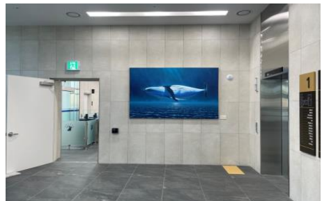
▲ 의정부 지방법원 남양주지원(남양주)