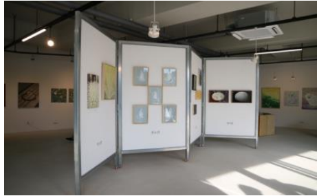
▲ <2022 아트경기 미술장터>(서울 아트조션스페이스) ▲ <2022 아트경기 미술장터>(파주 아트팩토리)