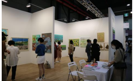
▲ 2022 아트페어 참가 <KIAF PLUS 부스전> (서울 SETEC)