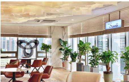
▲ 신한은행PWM 패밀리오피스 반포센터(서울)