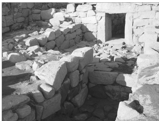
회암사지 지하시설 출입구

기전문화재연구원의 연보로서 경기지역 문화재 학술조사에 대한 종합전문지적 성격과 수도권문화재 분야의 연간 동향을 담은 『기전고고(畿甸考古)』제4호가 발간되었다.