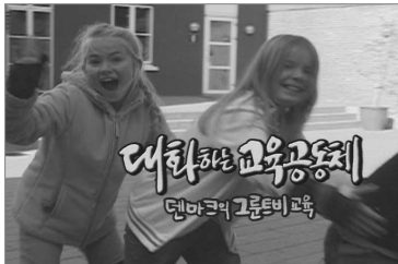
덴마크 구룬트비 교육 영상