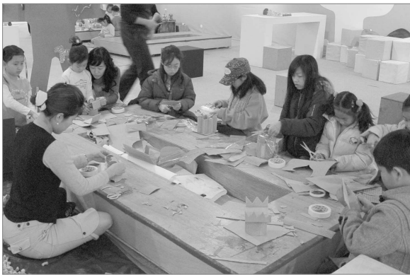
어린이 문화창조학교 도움아이-겨울축제

2005년도 기전문화대학의 주요사업으로는 크게 기전문화대학 교육프로그램 운영지원 사업과 청소년 교정시설, 어린이, 장애인, 노숙자 등 특수 계층을 위한 문화예술교육 프로그램 개발 운영, 문화기반시설 특성화 프로그램과 문화기획자 재교육 과정인 매개자 교육사업, 문화예술교육 교재, 매뉴얼, 커리큘럼 연구개발 사업으로 구분할 수 있다.