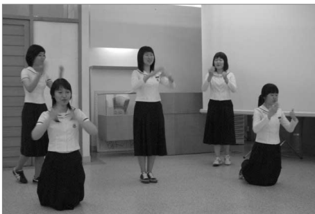
청소년 문화활동 지원심사 - 2차 프리젠테이션

차세대 문화예술의 주체인 청소년 문화예술 동아리 육성지원과 기획력 함양을 위한 「청소년 문화활동 활성화」지원사업은 자발적인 청소년 문화활동 동아리 프로젝트를 공모하여 총 33개