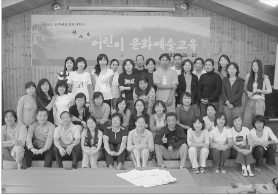
어린이 문화예술교육 워크숍