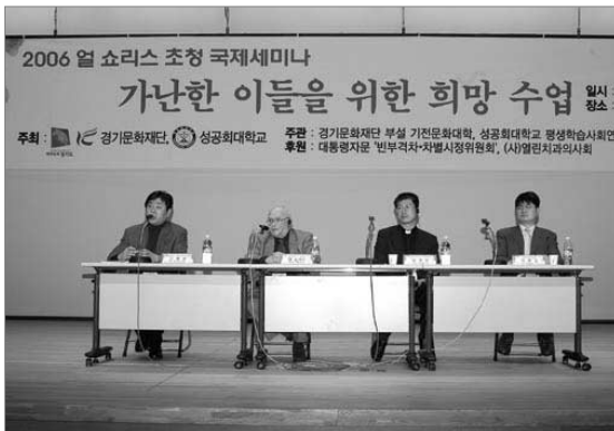
얼 쇼리스(Earl Shorris)초청 국제세미나