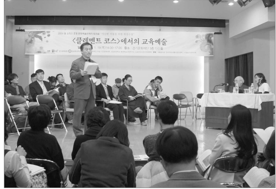
얼 쇼리스(Earl Shorris)초청 문화예술관계자 워크숍

기전문화대학의 문화예술교육 활성화를 위한 조사연구사업으로 2005년에는 ‘교사를 위한 전통색 교육 교재 개발’ 등 총 4개 연구과제가 완료되어 향후 기전문화대학 문화예술 교육 교재로 활용될 예정이다. 또한 문화예술교육의 방법론과 교육적 가능성을 연구 제안하여 경기도 문화교육 콘텐츠를 확보하기 위해, 해외 선진 평생학습 교육시스템과 교수법에 대해 구체적 사례를 바탕으로 2006년까지 총 10부작을 목표로 「이것이 미래교육이다」라는 영상교재 시리즈를 제작 중에 있다. 2005년에는 덴마크의 「그룬트비 학교」, 프랑스의 「프레네 학교」, 독일의 「몬테소리 학교」 사례를 영상물로 제작하여 보급하고 있다.