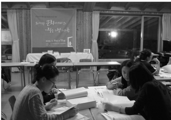
도서관 문화서비스 기획을 위한 워크숍