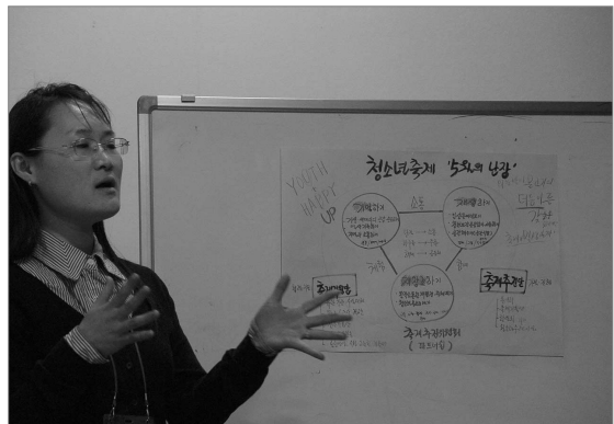
청소년문화시설 지도자 워크숍