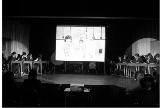
청소년 교정시설 문화예술교육