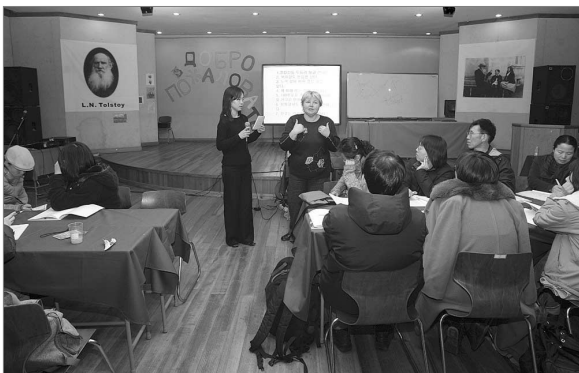
톨스토이학교 교사 워크숍