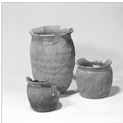
용인 삼막곡-연수원간 도로부지발굴조사 출토 토기류

2005년도 학술용역실적은 문화재 시굴조사 9건, 발굴조사 16건, 지표조사 13건, 보존처리 4건, 기타 연구용역 1건, 지난해 용역수주에 대한 사업 추가 증액 변경 18건 등 총 61건의 학술조사를 추진하여 총 167억 9,786만원의 용역계약을 수주하였다. 또한 발굴된 유물의 과학적인 보존 관리체계를 구축하기 위해 기전문화재연구원 내에 「보존과학실」을 2003년부터 설치 운영하고 있다. 또한 2005년에는 「전통문화실」을 설치하여 문화재 학술조사 연구에만 머무르지 않고, 그 활용을 위한 다양한 방법을 모색하고 있다.