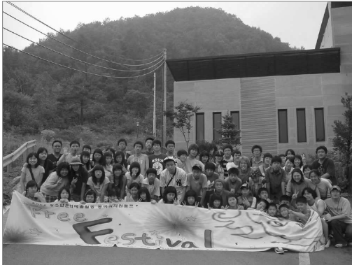
청소년 문화예술활동 동아리 지원 캠프

- 워크숍, 축제 등을 통한 청소년 활동영역 공유 및 경기도내 청소년 네트워크 계기 마련