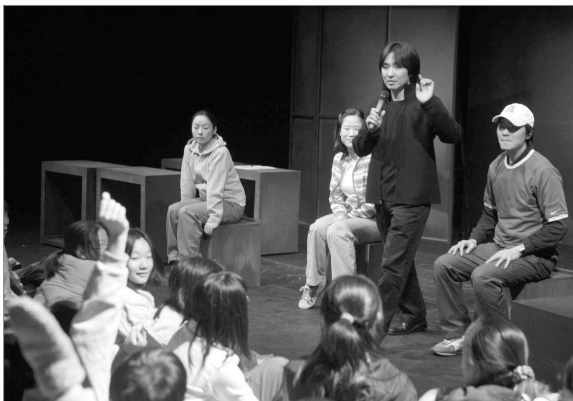
장애/비장애 통합교육 T.I.E 「푸른 고래의 꿈」