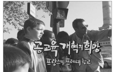
프랑스 프레네 교육 영상