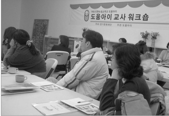
도움아이 교사 워크숍