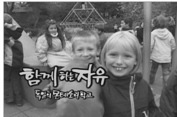
독일 몬테소리 교육 영상