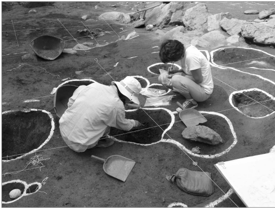
기전문화재연구원 매장문화재 발굴현장 남양주 사능-호평간 도로부지 발굴조사

일정한 면적 이상의 토지개발 시, 지표조사를 의무적으로 시행토록 문화재보호법이 개정 발효됨에 따라 재단에서는 경기도의 급증하는 개발수요에 부응하여 문화재를 효율적으로 보호하고자 1999년 4월 기전문화재연구원을 재단 부설로 설립 운영 중이다.