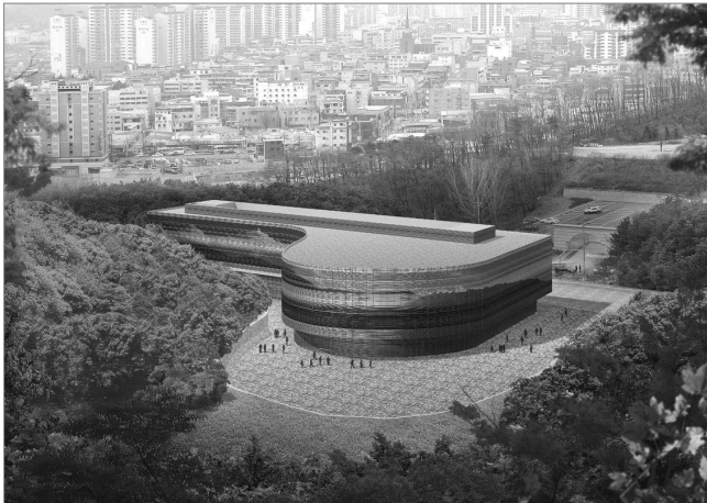
백남준 미술관 조감도

재단은 자체 목적사업 외에도 경기도와 시·군이 문화예술진흥을 위해 위탁한 사업을 자체 심의위원회를 통하여 수탁하여 추진하고 있다. 1999년 「효 사상고취프로젝트」사업을 시작으로 2005년 말까지 수탁 된 사업은 총 97개 사업에 1,191억 5만원의 사업비가 교부되었다. 2005년에 수탁 된 사업은 「2005 경기실학현양사업」등 총 8개 사업으로 위탁 사업비는 총 124억 1,633만원이 교부되었다.