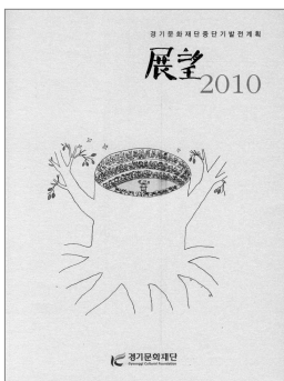
경기문화재단 중단기발전계획 『전망 2010』

‘사통팔달’은 “도로나 교통망, 통신망 따위가 이리저리 사방으로 통한다.”는 말이다. 재단은 이 ‘사통팔달’의 의미를 되새겨 경기도 각 지역 간 문화적 특성에 대한 연구를 바탕으로 다양성과 조화를 추구하며, 문화예술적 수준의 차이를 해소하기 위한 지원과 문화예술창작과 향유의 순환벨트를 구축할 ‘지역문화예술의 균형발전’ 과, 동아시아 소수민족, 생명문화, 생태, 공공·