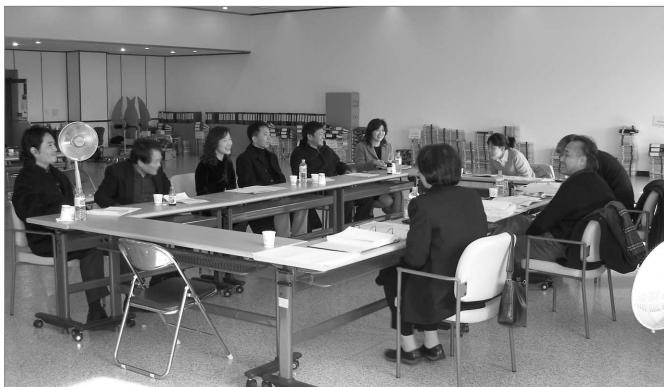
문예진흥공모지원사업 3차 인터뷰 심사

이상과 같이 3차에 걸친 심의 결과는 ‘한국문화예술위원회’ 정기공모 결정 자료와 비교한 중복지원사업과 ‘문예진흥기금’ 미납단체를 배제하고, 신청자격 결격자와 사업 최종확인, 지원금