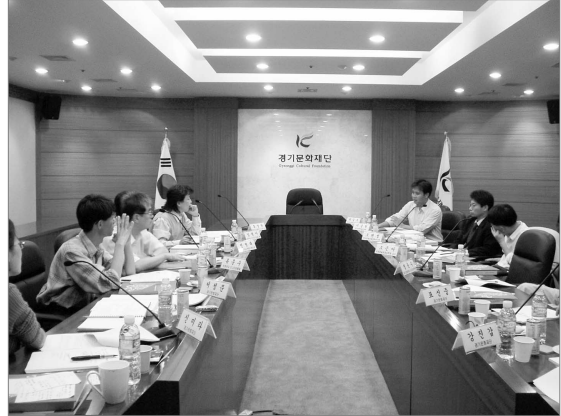
재단 모니터링 운영위원회