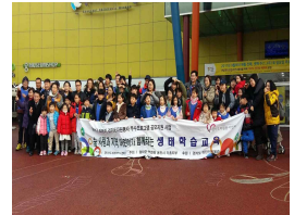
② 지역군부대 연계