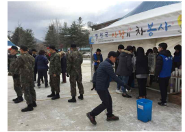
③ 세월호 참사 3주기 특별 전시