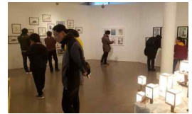
④ 아주대학교 VR체험