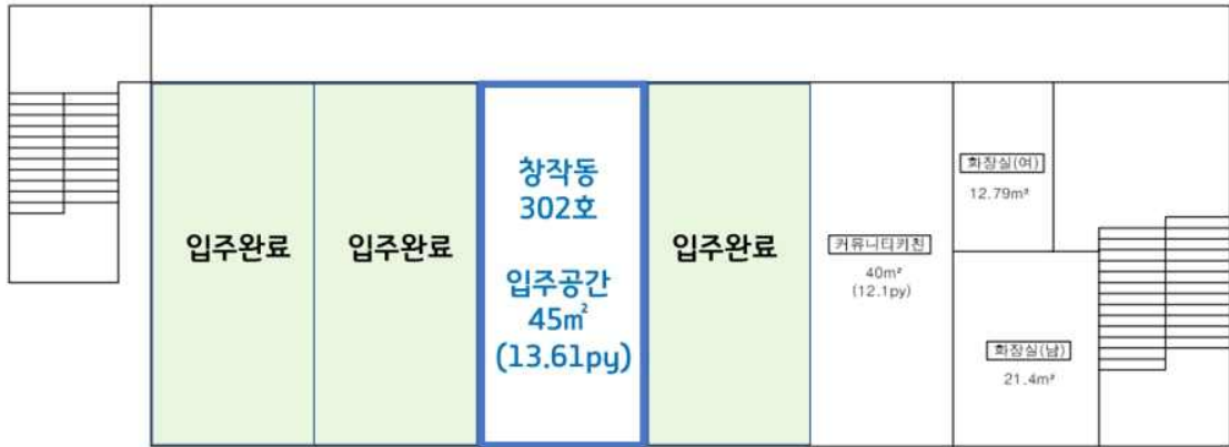
로컬 크리에이터 단체 입주공간 (창작동 3층) / 1실