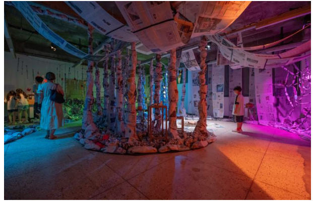
공간점유 - 양혜정_숲토리