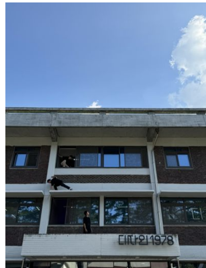
주제공연 - 리타이틀_“경로탐색”