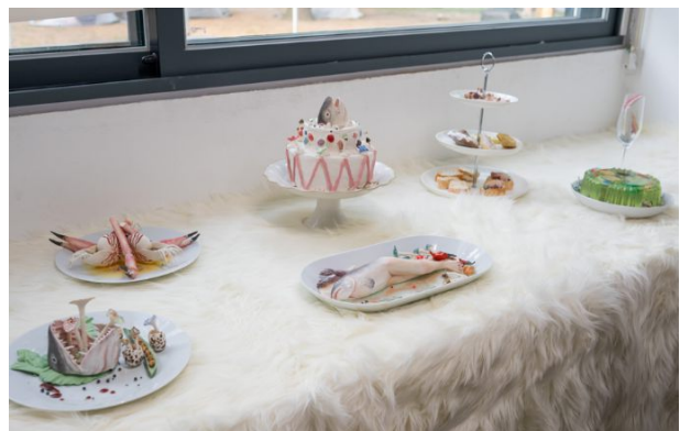
공간점유 - 류희연_식사하는 철학자들 문제