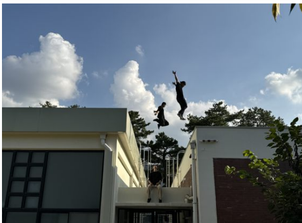
주제공연 - 리타이틀_“경로탐색”