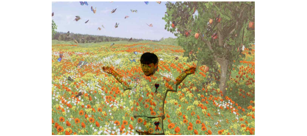
푸룻푸룻프렌즈 여름탐험대_체험단 사진