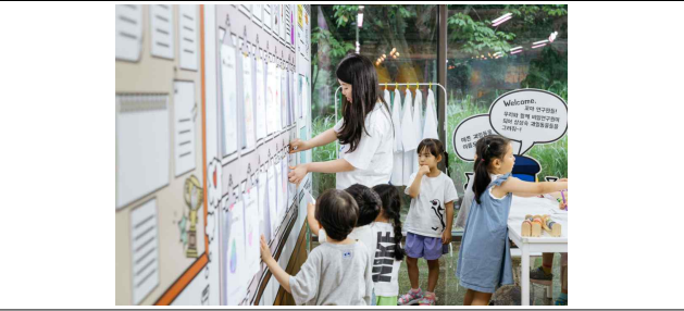
푸룻푸룻프렌즈 여름탐험대_체험단 사진