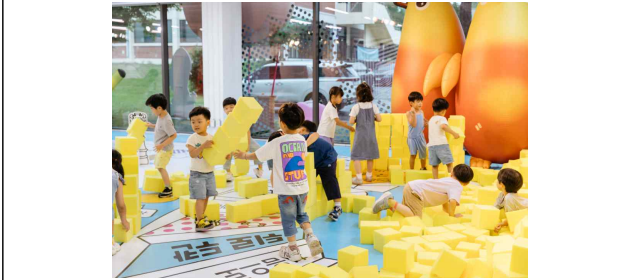
푸룻푸룻프렌즈 여름탐험대_체험단 사진