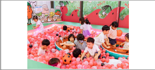
푸룻푸룻프렌즈 여름탐험대_체험단 사진