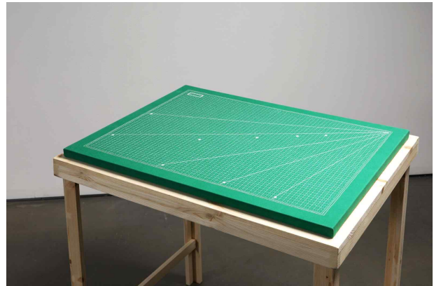
정철규 : <누구든지 오셔도 됩니다>, 옥스퍼드 원단 위에 손바느질 실드로잉, 72x55cm, 2020