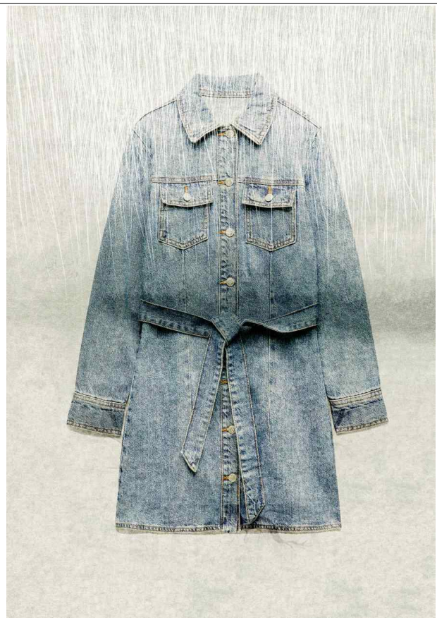
방인희 : <그녀의 기억 22-1>, 피그먼트 프린트, 실크스크린, 86x60cm, 2022