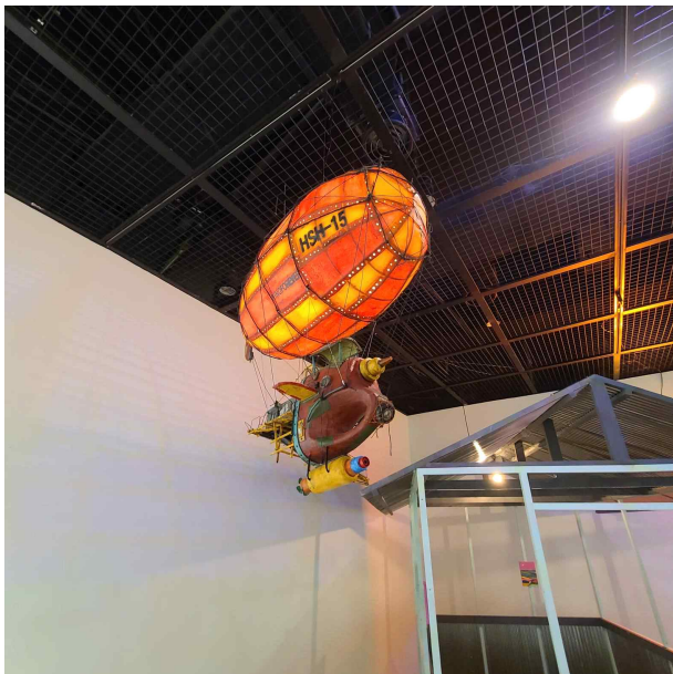
이찬주 : <우리집 시리즈 15호>, 캔버스 천, 철사, 플라스틱 폐기물, 노끈, LED, 90x40x77cm, 2021