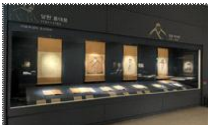
상설전시운영 - 제2전시실 2관