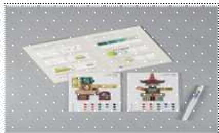
백남준아트센터 신규 상품 개발