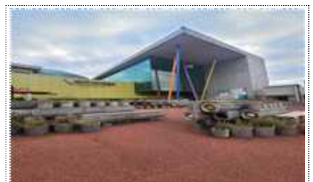
경기도어린이박물관 정문 조형물