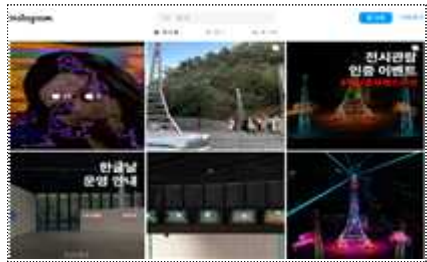
백남준아트센터 인스타그램 운영