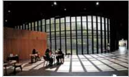
백남준아트센터 전시장 전경