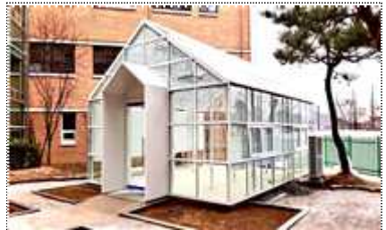
시흥 학교 문화예술공간 조성(완료)