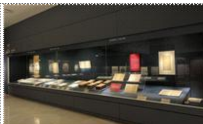
상설전시운영 - 제2전시실 3관