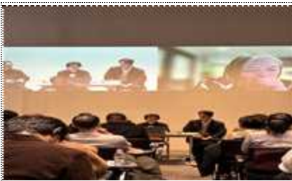
백남준의 선물 15