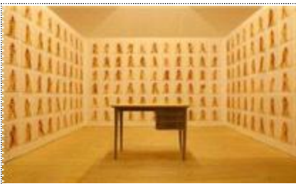
2016 4.16 2주기 추념전 전경