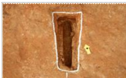
용인 반도체 318호선 발굴조사(무덤)