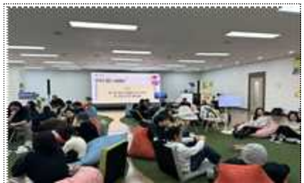
2023 경기도 예술인 라운드테이블 : 지역과 중앙 사이에서 예술하기