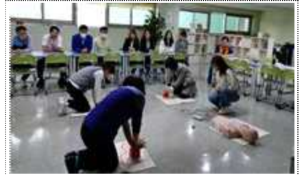
응급상황 대처법 교육 실시