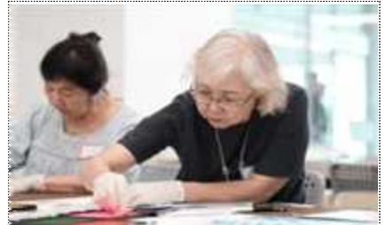
2023년 어르신 대상 교육 프로그램 운영