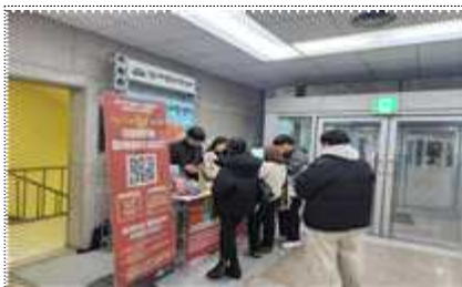
찾아가는 예술인 DB 등록 운영