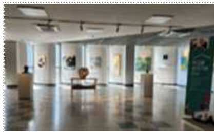
경기도교육청 학교로 찾아가는 전시