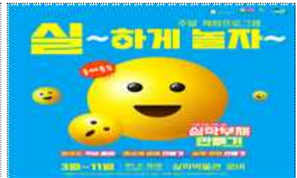
주말 체험프로그램 ‘실~하게 놀자’