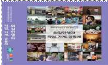
경기지역학 연구 활성화 결과보고서