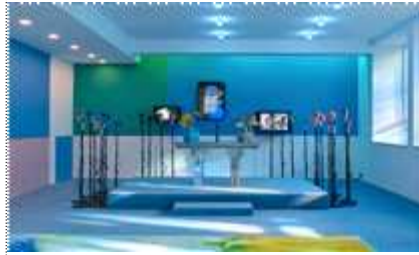
기획전 <빅브라더 블록체인>