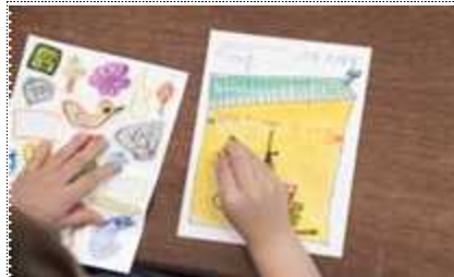
2023년 유아 대상 감상 활동지 작성