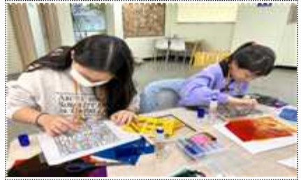
제14기 어린이자문단 활동