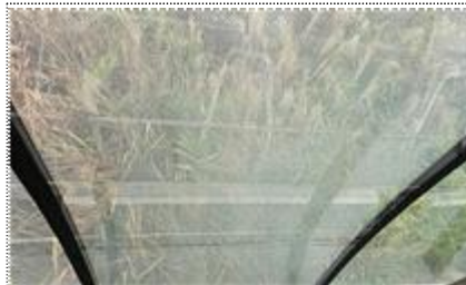
카페 전망용 창호(하부)