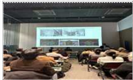
백남준의 선물 15