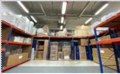
2023 외부임대수장고 관리