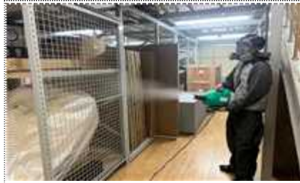
2023 수장고 훈증