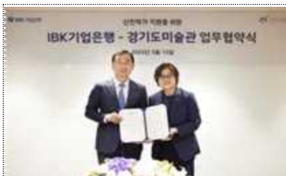
2023년 MOU 체결