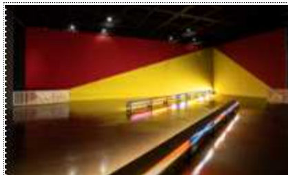
김은숙 <<8 Artists Voyage>>(2020, 성남큐브미술관) 전시 전경