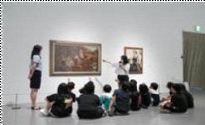
2023년 초등 대상 교육 프로그램 운영