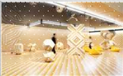
인천공항 '작가의 방'(2023 김용관)