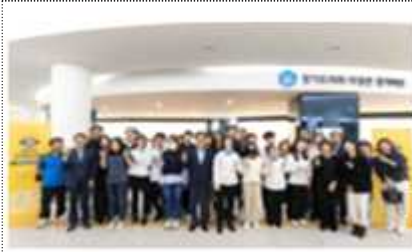
AI 활용 전시회