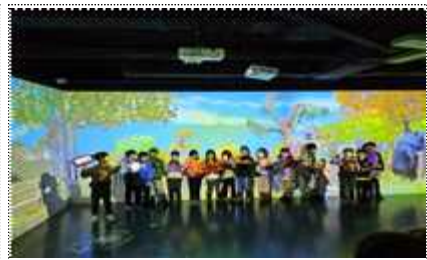
<두 개의 DMZ> 프로그램