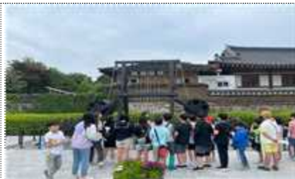
학교 연계 교육 ‘생생! 실학여행’