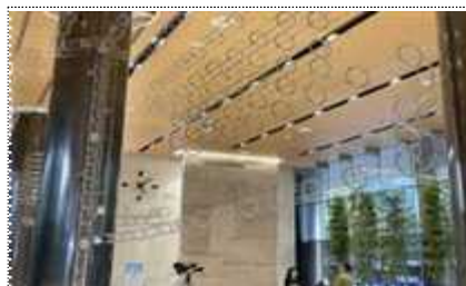
IBK기업은행 로비전시 진행