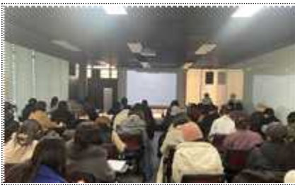
신규 도슨트 양성 교육 운영