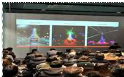
백남준의 선물 15