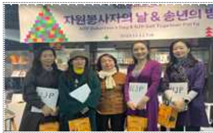
2023 자원봉사자 도슨트 송년 행사