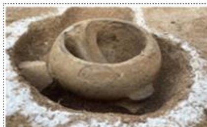
용인 반도체 발굴조사 출토유물