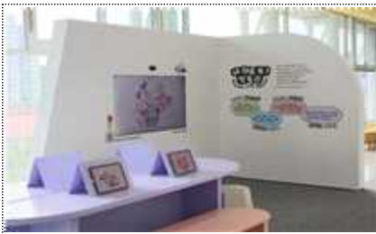
내 마음 씩 박물관