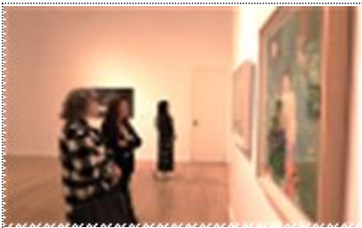
아르헨티나 일상의 풍경 전시