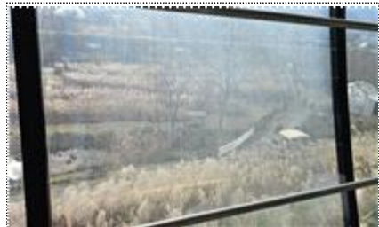
카페 전망용 창호(외부전경)