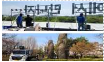
2023 소장품 보수