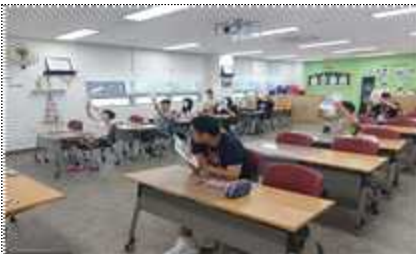
문화나눔 교육 ‘오늘은 내가 실학자’