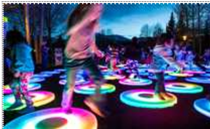
어린이를 위한 예술 놀이터(예시)