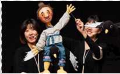
지역 & 대학 연계 공연 운영