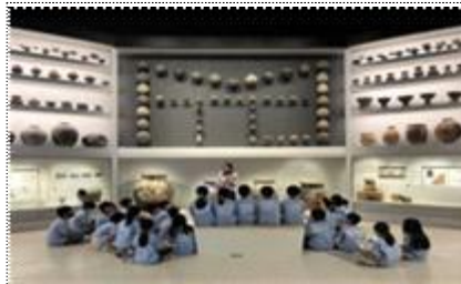
뮤지엄 아트 <여기가 경기>