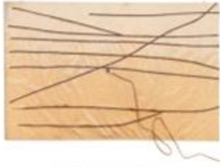
백남준 <랜덤액세스 오디오테이프>