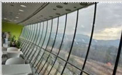
카페 전망용 창호(측면)