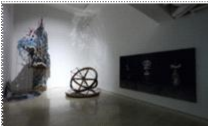
민성홍 <<두 개의 산, 두 개의 달, 그리고 물>>(2022, 봉산문화회관) 전시 전경