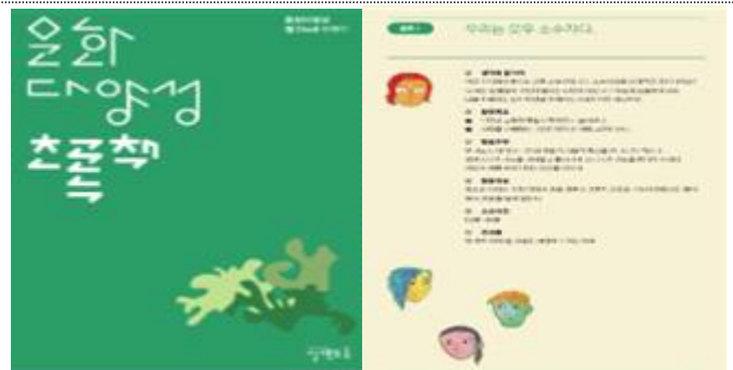
문화다양성 교육콘텐츠(그림책) 제작