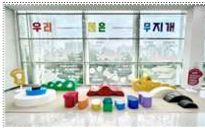
우리 몸은 무지개