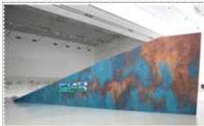
2016 4.16 2주기 추념전 전경