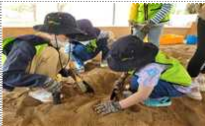
발굴체험교실 <선사인의 발명품>