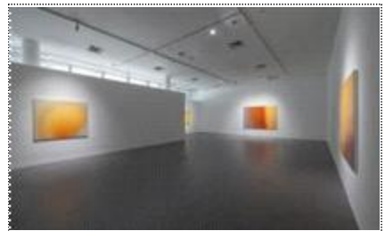
2021 4.16 7주기 추념전 전경