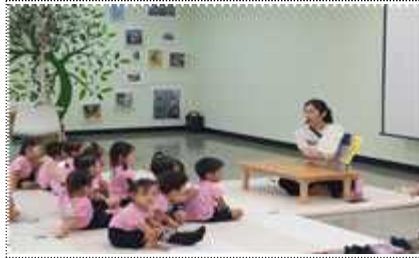
영아 동화구연 프로그램