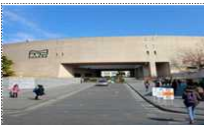
박물관 전시동 진입로 개선(예정)