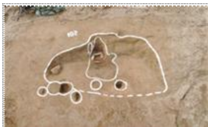
용인 반도체 발굴조사(집자리)