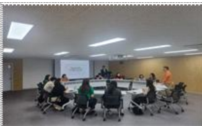
예술지원체계 고도화를 위한 광역문화재단 정담회