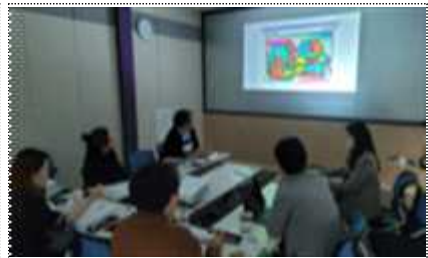
대중미술 장르 작품 구입 심의