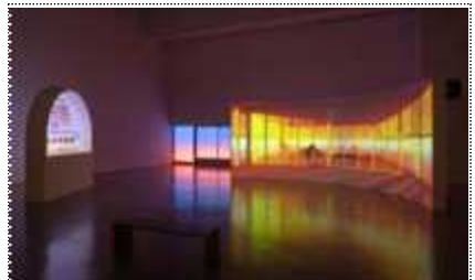
2022 동시대미술의 현장전 전시 전경